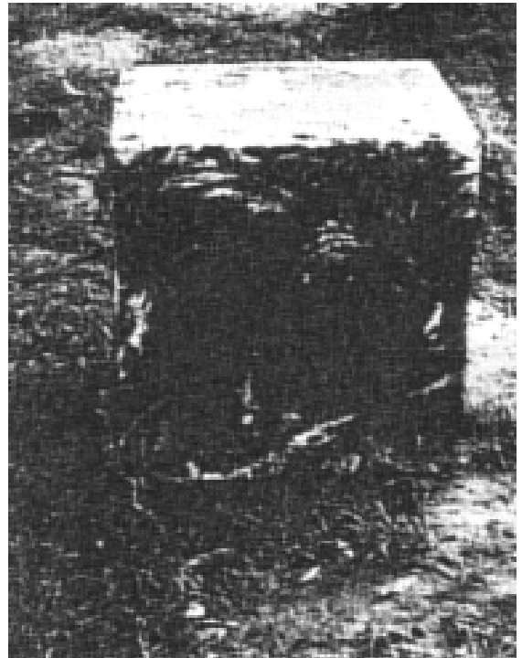
Verschlossen aber aufgeschnitten – diesen Tresor fanden die Anglerfreunde im Russenweiher.